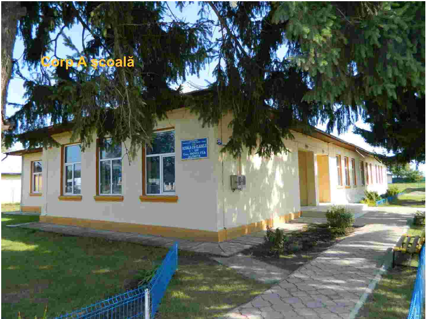
Corp A școală